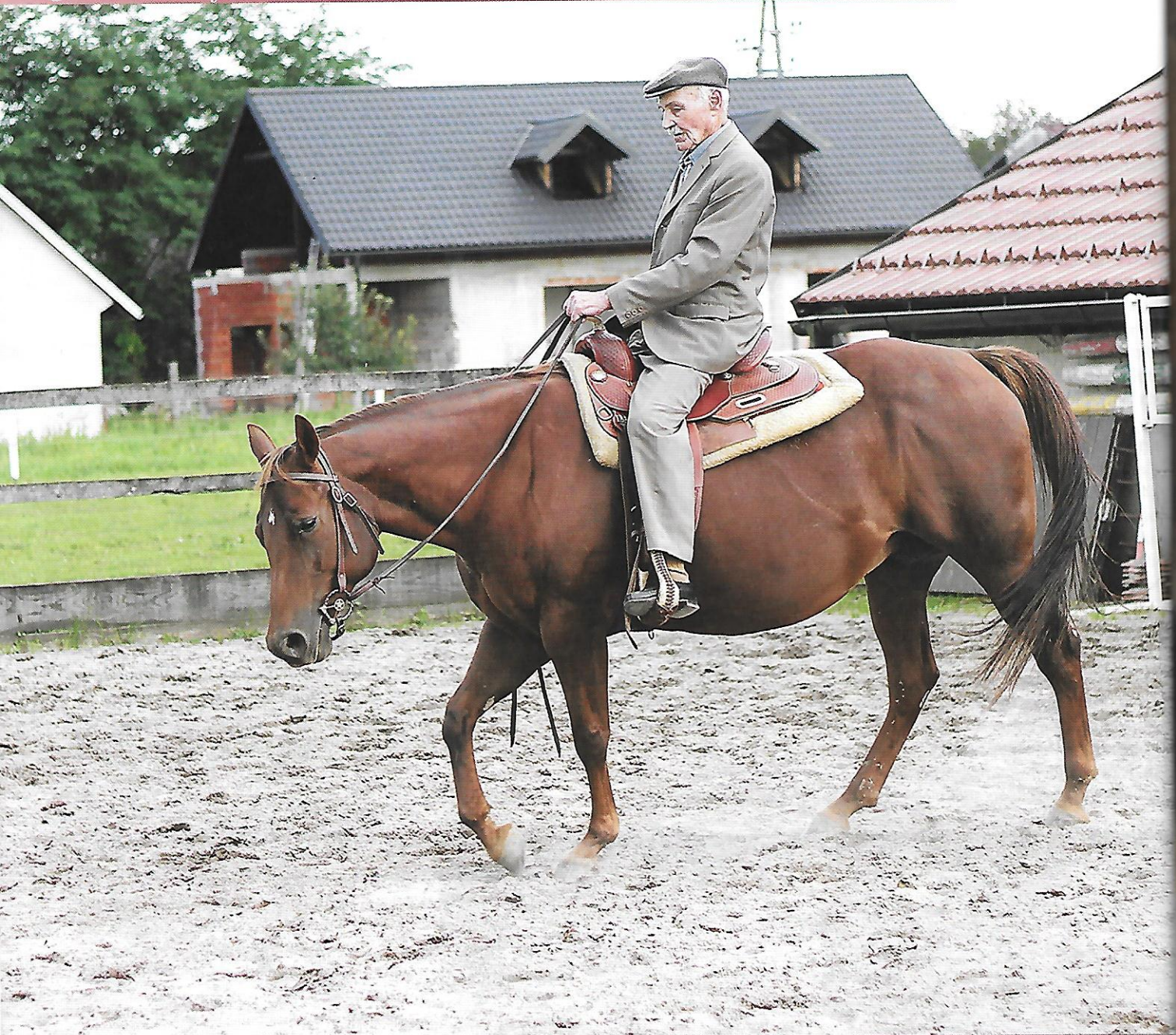
Pet let kasneje, pri 95 letih, se še vedno sam zavihti na konja.

hudo je otekel in veterinar, major po činu, ga je večkrat prišel pogledat. Sam sem ga veliko sprehajal. Naredil se je v krasnega konja in nihče ne bi uganil, da je to tisti zanemarjeni kosmati konj, kot je prišel v konjušnico.