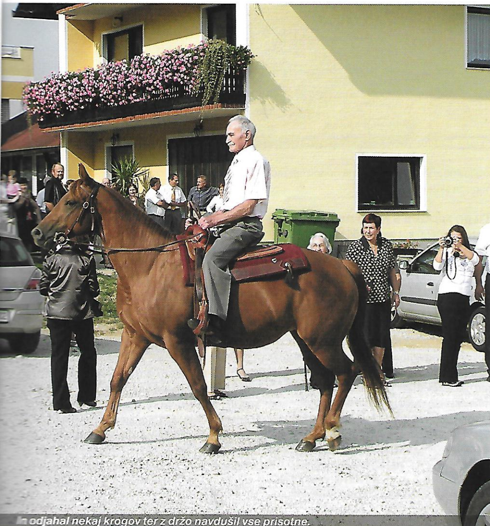
odjahal nekaj krogov ter z držo navdušil vse prisotne.

Skrbel sem tudi za konja, ki ga je pripeljal kmet, ko so se začele priprave na vojno. Takšnim smo rekli civilni konji . Takrat, ko je prišel, nisi vedel, ali je konj ali krava brez rogov. Imel je dolgo, štrnasto, zlepljeno dlako, pa tudi zibal se je, imel je medvedjo hojo. Njega sem hranil samo z ovsom in ga počasi čistil, kar z roko, brez krtače, da sem mu masiral kožo in počasi odstranjeval dlako. Uredil sem ga, da je bil svetleč in črn kot oglje. Ko so ga kastrirali, se je zapletlo, ▶